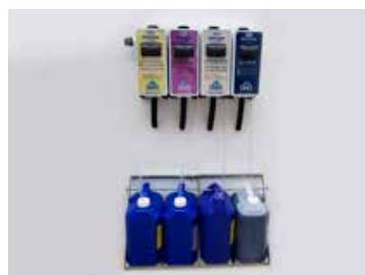
Sistema de diluição individual