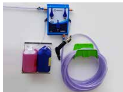
Diluidor DHD - com 2 entradas para químicos mais enxágue